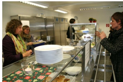
Eltern helfen in der Mensa

Die Mittagsmahlzeit bietet den SuS die Möglichkeit, sich für den Rest des Schultages zu stärken. Wir legen einen besonderen Wert darauf, dass alle SuS in die Mensa gehen , damit sie lernen, im sozialen Kontext eine „Tischkultur“ zu pflegen und Verantwortung zu übernehmen. Sie erfahren, dass Tischgespräche eine neue Dimension des Schulalltags sind und lernen, auf die anderen SuS am Tisch Rücksicht zu nehmen, indem sie dafür Sorge tragen, dass erst, wenn alle die Mahlzeit beendet haben, abgeräumt wird. Alle SuS, die an einem Tisch zusammen essen, räumen am Ende gemeinsam auf.