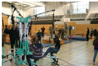
Übungen am „Body-Spider“ in der Turnhalle

Ein SPA- Angebot pro Woche sowie die mittwochs in der Sporthalle stattfindenden „Flashmob“- bzw. anderen Sportangebote sind verpflichtend. Am Ende der Jahrgangsstufe 6 sollen alle SuS mindestens ein Angebot aus jeder Säule kennengelernt haben, damit sie eine Erfahrungserweiterung und Entscheidungshilfe für zukünftige Schwerpunktsetzungen erfahren. Somit wird eine begabungs- und bedürfnisorientierte Förderung möglich.