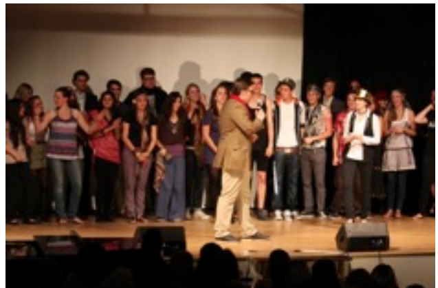
Alle Mitwirkenden auf einen Blick