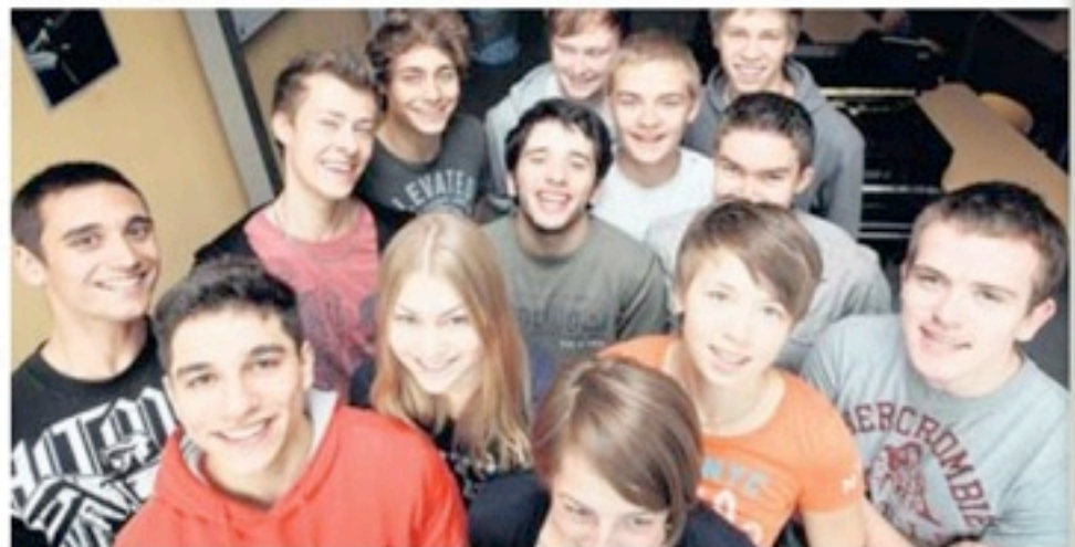
Schüler der Jahrgangsstufe 12 haben sichtlich Spaß an zeitgenössischer Kunstmusik gefunden.

Um die Schüler aus einer passiven Rezeptionshaltung heraus-